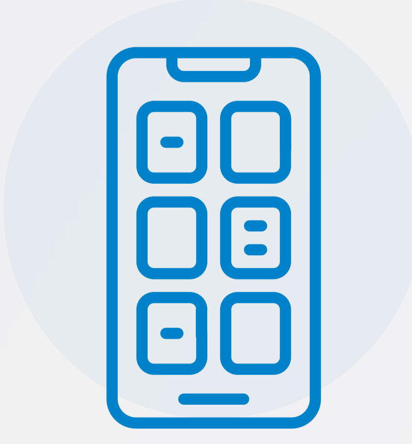
تطبيقات الهواتف الذكية