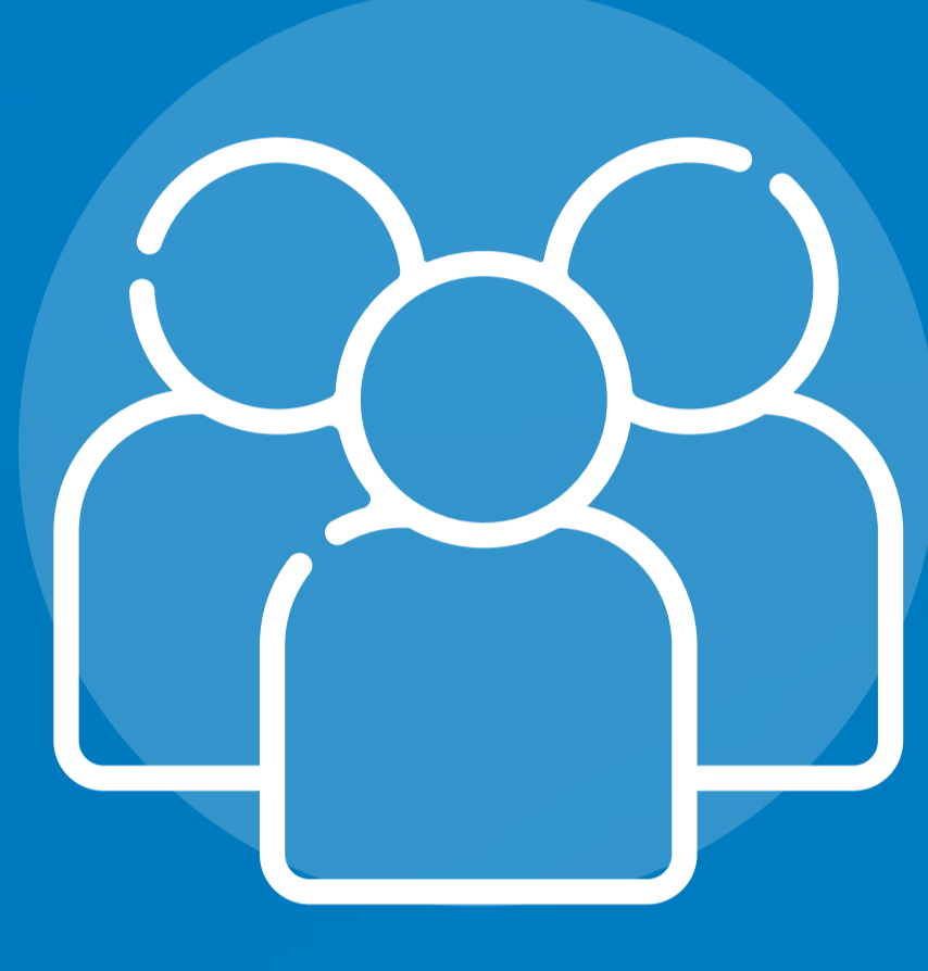
بيانات التركيبة السكانية للعملاء