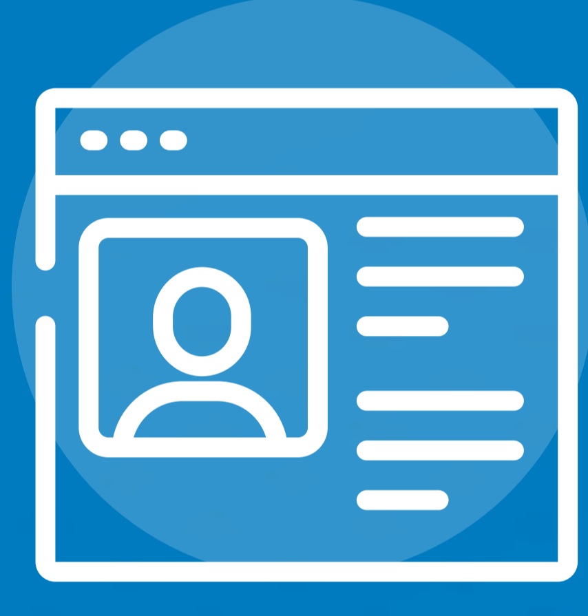
بيانات العملاء الشخصية