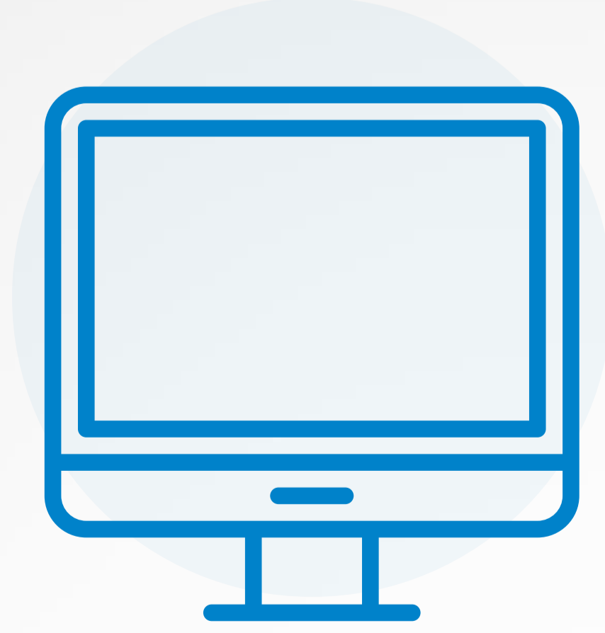
نقاط البيع (POS)

الجزء الأول من سلسلة الأمن السيبراني في التجارة الإلكترونية