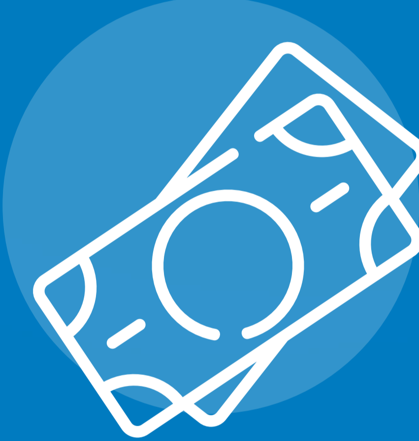
بيانات العملاء المالية